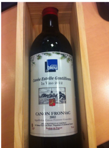
La bouteille de Vin