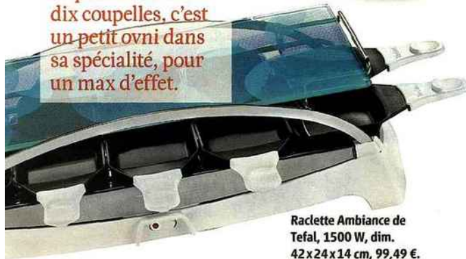
Raclette Ambiance de Tefal, 1500 W, dim. 42x24x14 cm, 99,49 €.

Avec son plateau en verre trempé ultra-résistant de 6 mm d'épaisseur et ses dix coupelles, c'est un petit ovni dans sa spécialité, pour un max d'effet.